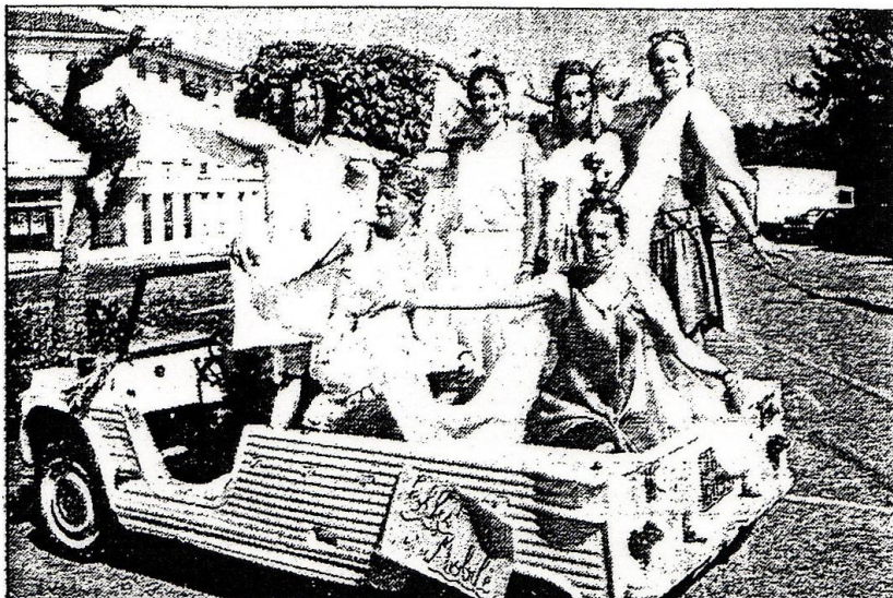
Un succès bien mérité pour les Elfes

Organisé par l'association Nougatine, le premier festival de théâtre a eu lieu dernièrement toute la journée. Le soleil était au rendez-vous et le public a pu assister à des représentations données en divers endroits de la commune : la place du Général-de-Gaulle, le parc de la mairie, mais aussi chez plusieurs commerçants (boulangerie, brasserie...). Malgré une organisation sans faute, le public ne s'est pas montré très nombreux pendant la journée, sans doute à cause de concurrence de la plage... Cependant, le soir, les spectateurs se sont pressés dans le parc de la mairie.